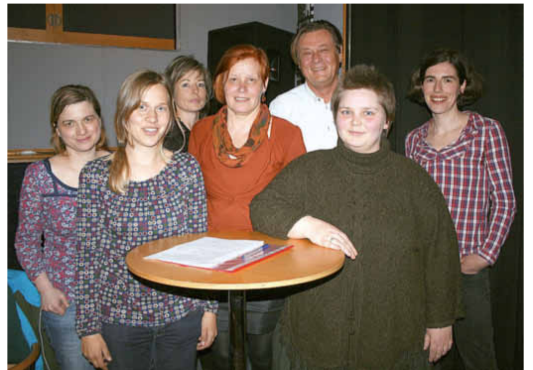
Der Vorstand mit Beisitzern vom „Kunst- und Kulturrat Mecklenburgische Seenplatte“ kurz nach der Wahl.